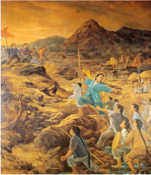
▲이순신의 소년 시절.