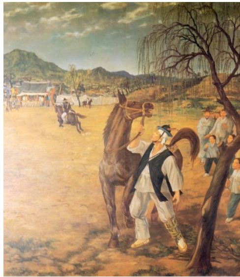
▲이순신의 청년 시절. 무과 시험 낙마.